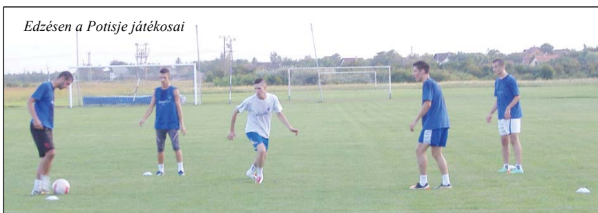
Edzésen a Potisje játékosai