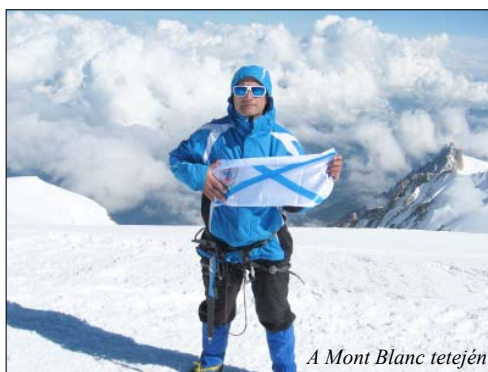
A Mont Blanc tetején

– Az első állomásunk egy kis olasz faluban volt, több mint háromezer méter magasságban, hogy a szervezetünk megszokja a légnyomást. A vezetőink azt mondták, hogy a szervezetbe mindig annyi folyadékot kell bevinni, ahány méter magasan vagyunk. Mi este 6 körül értünk a szálláshelyre, így mindössze néhány óránk volt, hogy a szükséges vízmennyiséget bevigyük. Mondanom sem kell, hogy éjjel alig aludtunk, folyton azon nevetgélünk, hogy egymásnak adtuk a kilincset a mellékhelyiségbe. Másnap derült ki, hogy arra napra, amikor a Mont Blanc csúcsát akartuk megmászni, rossz időt jósoltak, így gyorsan döntöttünk, hogy amint lehet továbbindulunk, hogy egy nappal korábban érjünk fel. Ezzel persze felborult a szállásfoglalásunk és minden előzetes tervünk. Másnap már buszban ültünk Franciaország felé, és erőltetett menetben haladtunk fent a hegyen is,