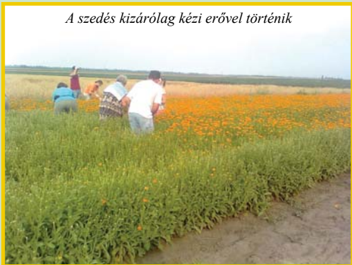
A szedés kizárólag kézi erővel történik