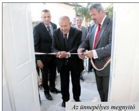
Az ünnepélyes megnyitó