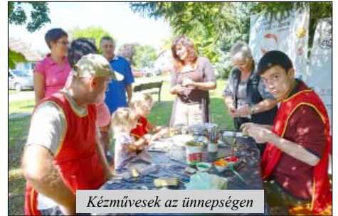
Kézművesek az ünnepségen