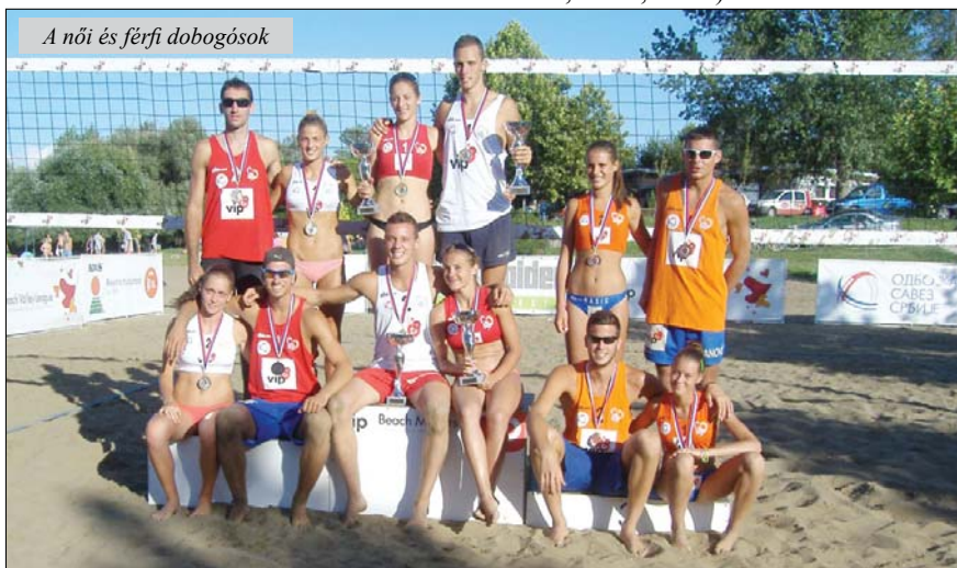
A női és férfi dobogósok