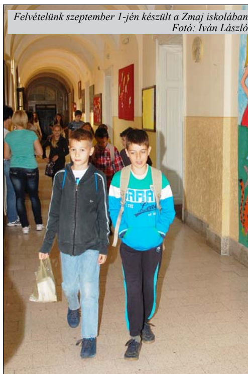
Felvételünk szeptember 1-jén készült a Zmaj iskolában

Mindezeket azért írtam le, mert pedagógusi munkám során nap mint nap szembesülök azzal, hogy a szülői vágyak és a gyermeki adottságok mennyire ellentmondásosak!