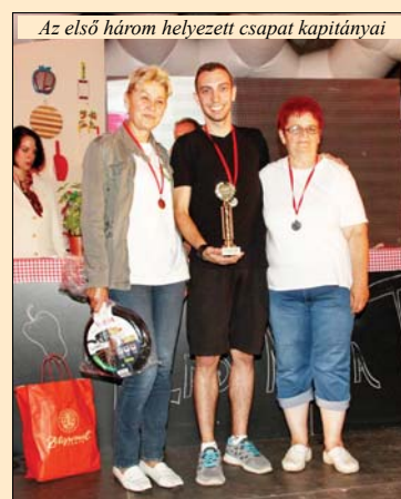
Az első három helyezett csapat kapitányai