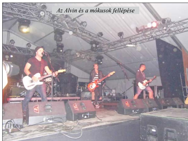
Az Alvin és a mókusok fellépése