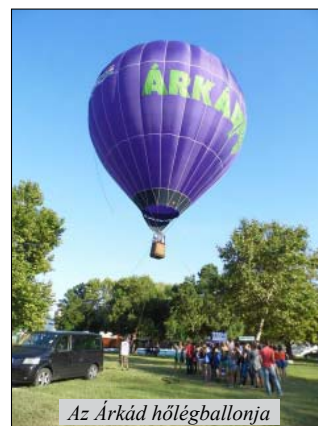
Az Árkád hőlégballonja

Gutási Gábor http://ggwebsite.com