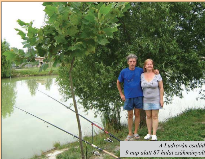
A Ludrován család 9 nap alatt 87 halat zsákmányolt

szantott, hogy ezért a „reklámozott csendért és nyugalomért” tisztességes árat kellett fizetnünk. Gyakorlatilag nem azt kaptuk, amiért fizettünk. Ide a tanyára egy kanizsai látogatásunk alkalmával jöttünk ki először. Sok jót hallottunk róla, hát nézzük meg, ha már itt vagyunk. Amikor beléptünk az impozáns kapun, mintha