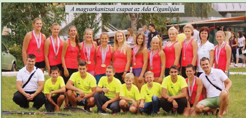
A magyarkanizsai csapat az Ada Ciganliján