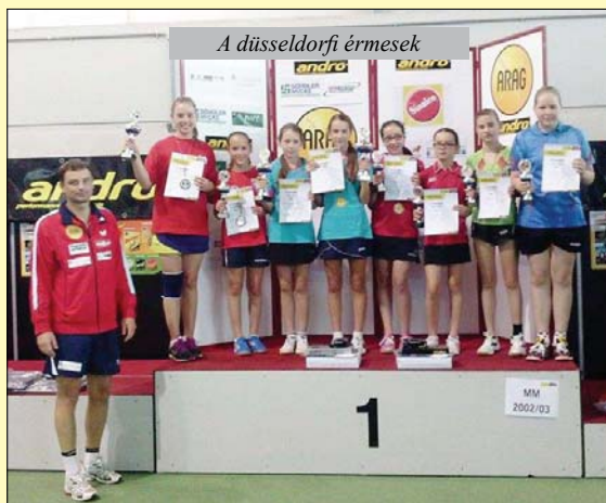
A düsseldorfi érmesek