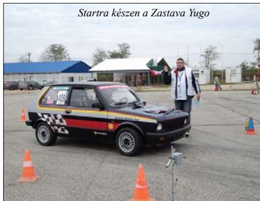
Startra készen a Zastava Yugo