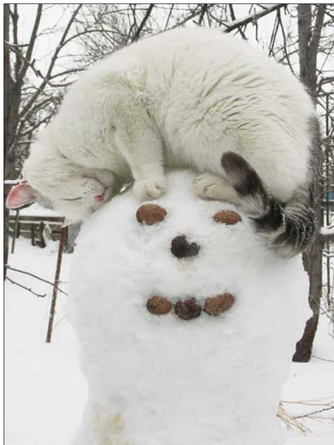
A hóember alkalmi fejedője