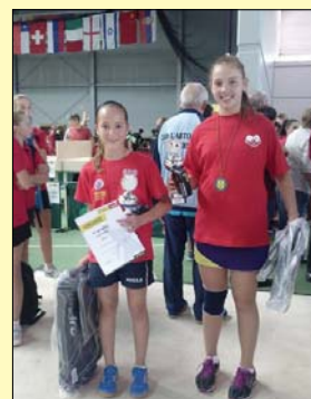
A düsseldorfi ezüstérmes páros