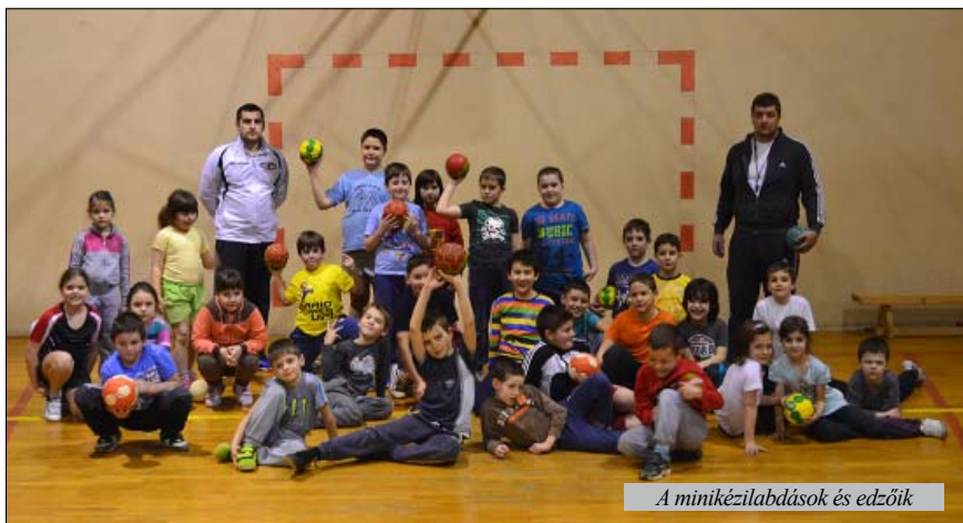
A minikézilabdások és edzőik