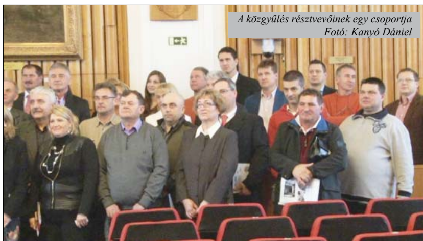
A közgyűlés résztvevőinek egy csoportja