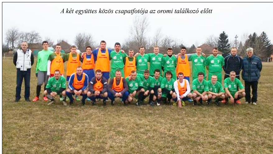
A két együttes közös csapatfotója az oromi találkozó előtt