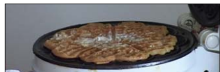
A gofrisütőben készült kenyér