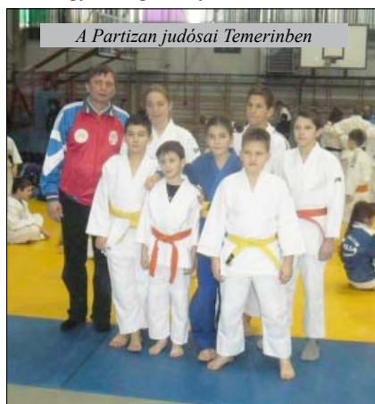
A Partizan judósai Temerinben