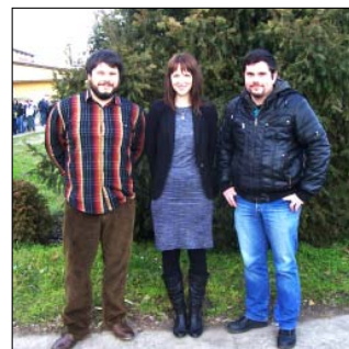
A lelkes pedagógusok