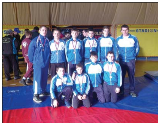
A Potisje idősebb pionír birkózói Szabadkán