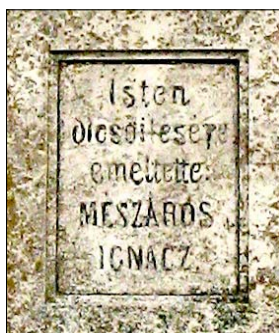
A Mészáros út kezdetét jelző kőkereszt egy körülnyesett parton áll a pusztában rajta az írással

1835-ben lett papnövendék, majd bölcsészhallgató az Egri Szemináriumban. Azt követően 1843-ig írnok illetve hivatalsegéd az Érseki Hivatalban. 1844 és 1852 között