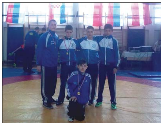
A Potisje és a Zenta birkózói Zágrábban

A csapatverseny élcsoportja: 1. Spartak (Szabadka) 45, 2. Radnički (Zombor) 27, 3. Novi Sad 18 pont.