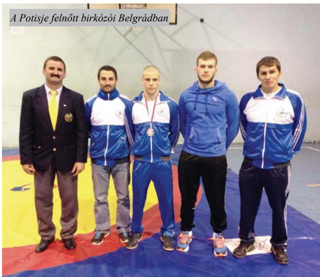
A Potisje felnőtt birkózói Belgrádban