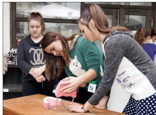
Maketten kellett bemutatni a helyes fogmosást

A középiskolások vetélkedőjét a magyarkanizsai Beszédes József Mezőgazdasági és Műszaki Iskolaközpont öt csapatának és a Bárka foglalkoztató egy csapatának részvételével bonyolították le. Az első három helyet középiskolás csapatok foglalták el. A legjobb a 2/4 osztály lett 135 megszerzett ponttal, mögötte az 1/4, illetve az 1/2 osz-