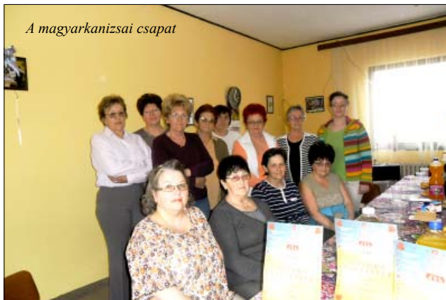
A magyarkanizsai csapat