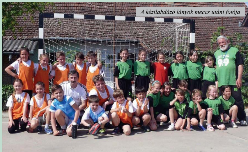
A kézilabdázó lányok meccs utáni fotója