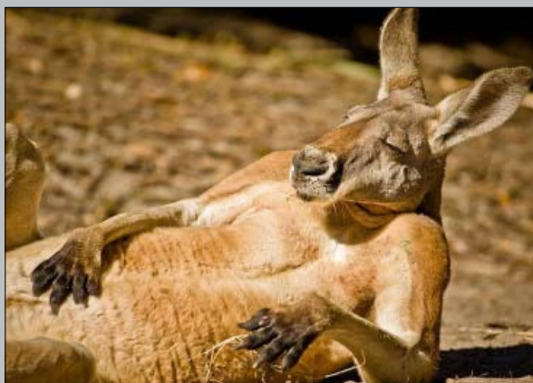
Lassan, de biztosan itt a jó idő!

– Hát mer mikó egyszer a városban betértem a hivatalba, láttam ott egy ajtót. Ki volt írva, hogy NŐK, bementem, oszt WC vót.