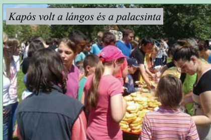
Kapós volt a lángos és a palacsinta

A Rozmaring Népdalkör hölgytagjai frissen sült lángossal és palacsintával vendégelték meg az esemény résztvevőit. Elmondásuk szerint több mint 500 lángost és ezernél is több palacsintát kisütöttek a nap folyamán, amiből még a délutánra is jutott.