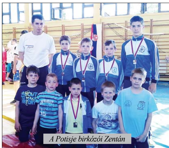
A Potisje birkózói Zentán