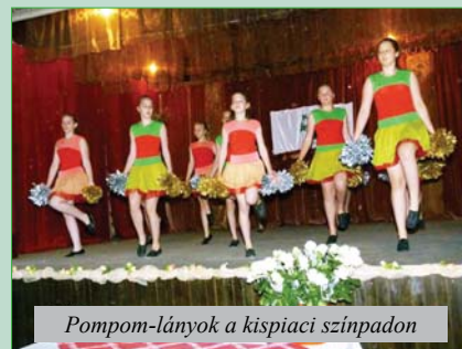
Pom-pom-lányok a kispiaci színpadon

– Kispiacon már hagyománnyá vált, hogy minden év májusának első hétvégéjén falunapot tartunk. Most a május elsejei ünnepek miatt egy héttel később tartottuk meg. Megpróbáltunk egy gyermeknappal egybekötött, vidám falunapot szervezni, amely a már említett eseményeket követően kultúrműsorral folytatódik, amelyben a helyi ovisok, az általános iskola diákjai valamint a Jókai Mór Művelődési Egyesület tagjai vesznek részt. A rendezvényen jutalmakat adunk át a falu legkisebb lakóinak, az utóbbi időben született kisgyermek-