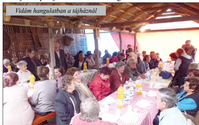
Vidám hangulatban a tájháznál