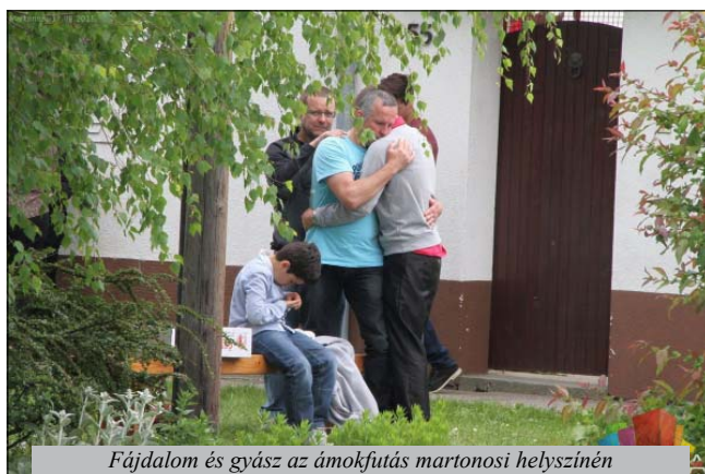
Fájdalom és gyász az ámokfutás martonosi helyszínén