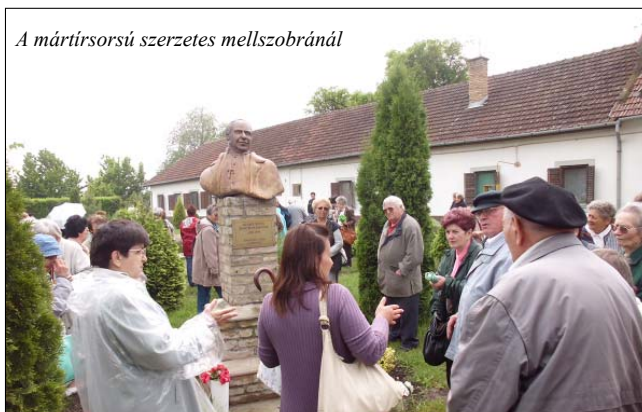
A mártírsorsú szerzetes mellszobránál