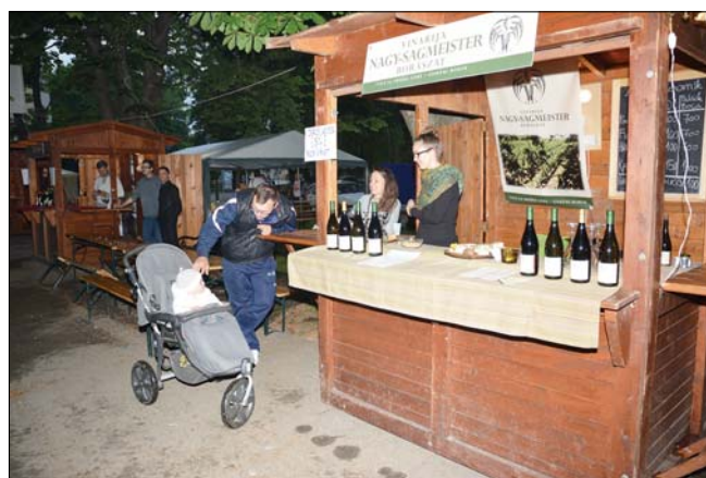
A Nagy-Sagmeister borászat is jelen volt termékeivel

A korábbi évek tapasztalataiból látszik, hogy szükség van városunkban egy ilyen rendezvényre, mint ami az elmúlt hétvégén volt a városháza előtti kisparkban, nevezetesen a borfesztivál, amit idén negyedszer szerveztek meg és kétnaposra sikeredett. Pénteken a hűvös idő ellenére is kilátogattak az emberek, hogy megnézzék és megkóstolják a környékbéli borászok ízletes borait, amelyekből kiállítást is láthattak. Hat pincészet mutatkozott be: a Bálint, a Nagy-Sagmeister és a Harmath Borászat Magyarkanizsáról illetve Horgosról, a Brindza pincészet Topolyáról, valamint az ismert Maurer és a Bacchus Borászat is jelen volt termékeivel. Szombaton igazi térzene fogadta a látogatókat, nagyszerű hangulatot teremtett a zentai fúvószenekar, majd késő estébe nyúlott a fesztivál programja. A borok mellett kürtöskalács, vattacukor és lacipecsenye is várta a vendégeket. A borkóstolón e sorok írója megállapította, a Brindza-borászat nedűi voltak a legfinomabbak, persze ez egyéni ízlést takar. Mindegyik bor finom volt, mert szinte mindenki kezében ott láthattuk a poharat.