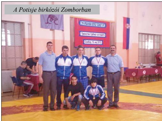
A Potisje birkózói Zomborban

Csapatversenyben első a zombori Soko 34 ponttal, második a Zenta 31 ponttal.