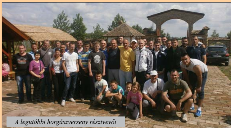
A legutóbbi horgászverseny résztvevői