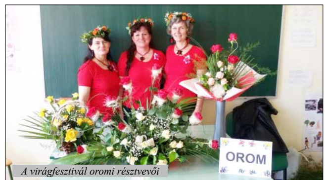
A virágfesztivál oromi résztvevői