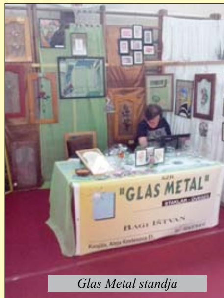
Glas Metal standja