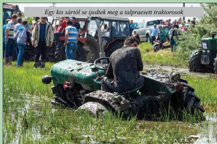
Egy kis sártól se ijedtek meg a talpraesett traktorosok