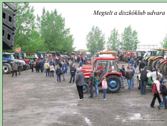
Megtelt a diszkóklub udvara