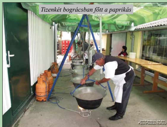
Tizenkét bográcsban főtt a paprikás