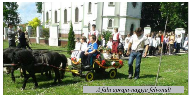
A falu apraja-nagyja felvonult