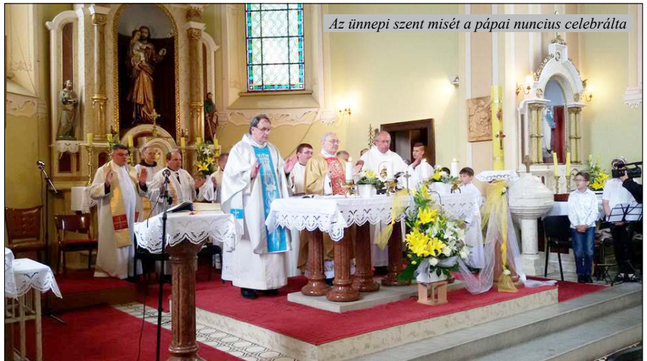
Az ünnepi szent misét a pápai nuncius celebrálta