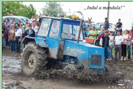
„Indul a mandula!”