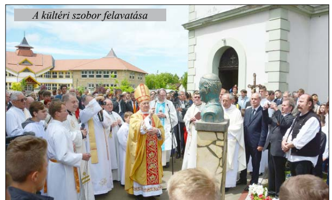
A kültéri szobor felavatása