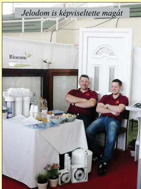
Jelodom is képviseltette magát