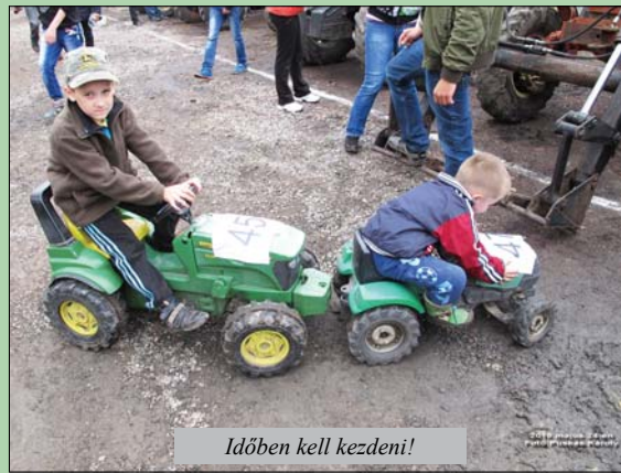
Időben kell kezdeni!