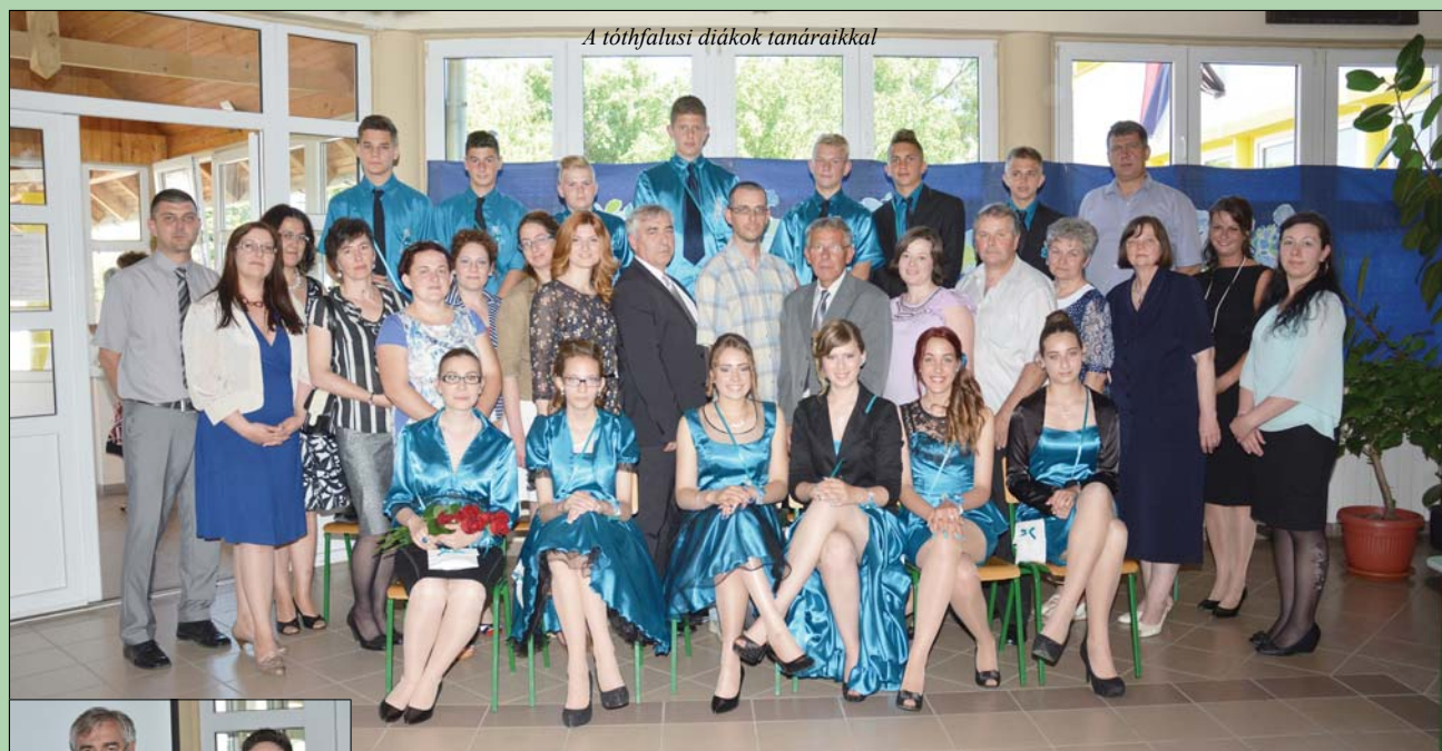
A tóthfalusi diákok tanáraikkal

Képes beszámoló a tóthfalusi és az oromi ünnepségről