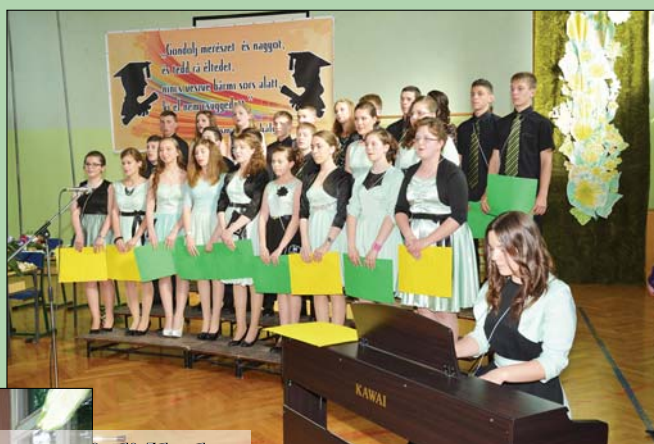
Az oromi diákok