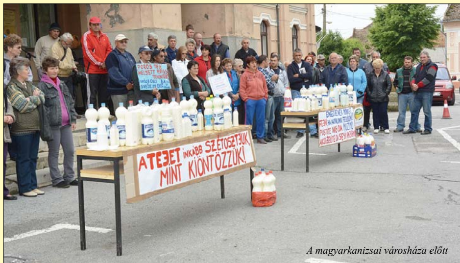
A magyarkanizsai városháza előtt

A polgárok mellett a magyarkanizsai önkormányzat is felsorakozott a tejtermelők követelése mögé, bár arra, hogy bármilyen módon közvetlenül is hasson a kormányra vagy a mezőgazdasági minisztériumra, neki sincs kompetenciája.