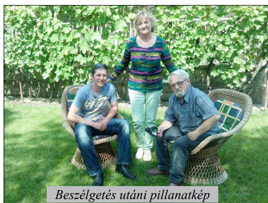
Beszélgetés utáni pillanatkép