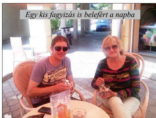
Egy kis fagyizás is belefért a napba

– A közhiedelemmel ellentétben ilyenkor nem vidám, pörgős dalokat a legjobb eljátszani, hanem olyanokat, amelyek megérintik az ember