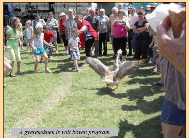
A gyerekeknek is volt bőven program