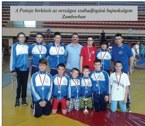
A Potisje birkózói az országos szabadfogású bajnokságon Zomborban

zón mindkét oldalon akadtak gólhelyzetek, de a kapusok többször is remek formában hártottak. A meccsen a vendégek csatára Rahić remekelt, aki mesterhármast ért el. A mérkőzésen a játékvezető három hazai és egy vendégjátékosnak mutatott fel sárga lapot különböző szabálytalanság miatt.