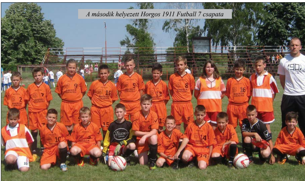
A második helyezett Horgos 1911 Futball 7 csapata