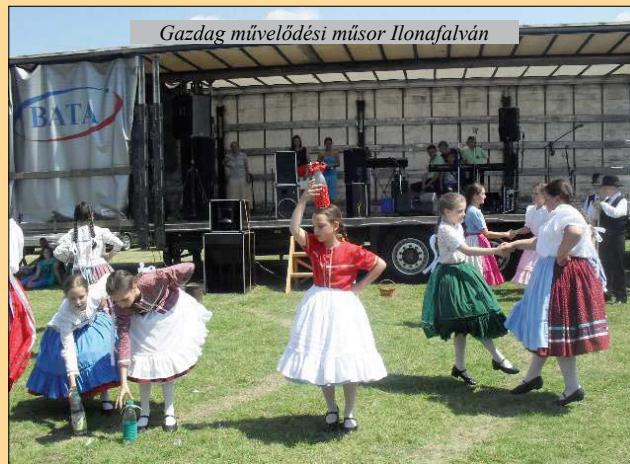
Gazdag művelődési műsor Ilonafalván

A támogatóknak és a szervezőknek köszönhető, hogy a nagyszabású egész napos rendezvény igen jól sikerült. A látogatók aprajánagyja elégedetten, maradandó élményekkel gazdagodva távozott. Reméljük, jövőre ismét találkozunk.