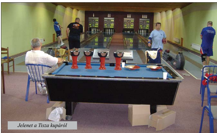
Jelenet a Tisza kupáról