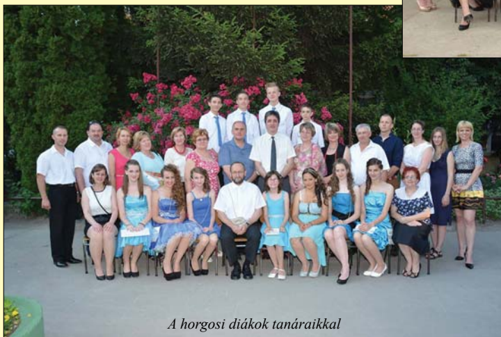
A horgosi diákok tanáraikkal