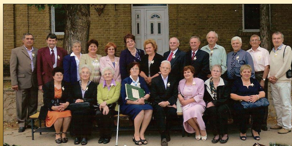
50 éves osztálytalálkozó Orom, 2015.06.19.