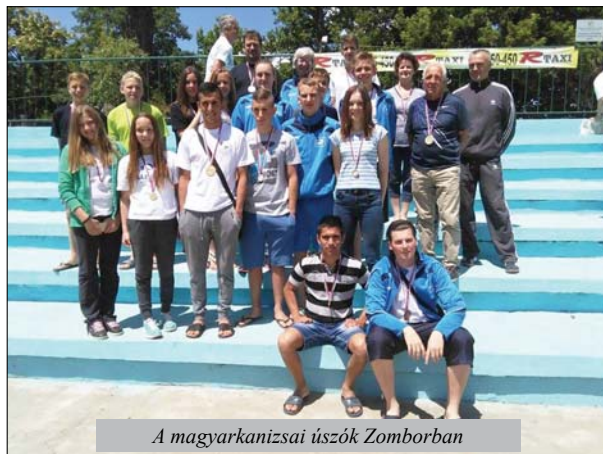
A magyarkanizsai úszók Zomborban

Zomborban rendezték meg az 1. Szerbia Open kupa 2015 nyílt vízi maratoni úszóversenyt két távon (2000 m és 5000 m), amelyen a magyarkanizsai Kanizsa Úszó klub 23 versenyzője vett részt. A magyarkanizsai úszók sikeresen kezdték meg az idei versenyzést, összesen húsz érmet (kilenc arany, négy ezüst, hét bronz) nyertek.