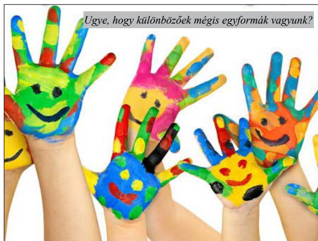
Ugye, hogy különbözőek mégis egyformák vagyunk?