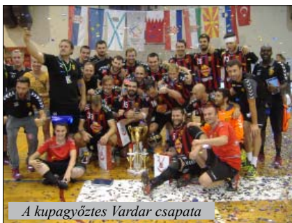
A kupagyőztes Vardar csapata

Az első három nap a csoportmérkőzéseket játszották le, vasárnap pedig a helyosztó meccsre került sor. Eredmények.