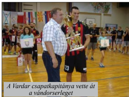
A Vardar csapatkapitánya vette át a vándorserleget