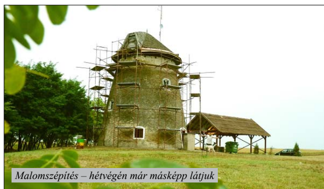
Malomszépítés – hétvégén már másképp látjuk