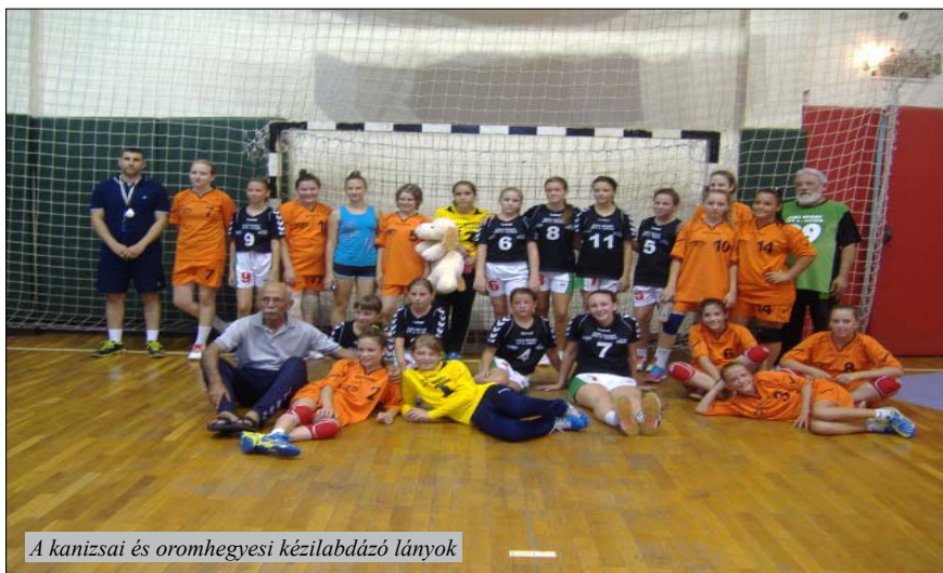
A kanizsai és oromhegyesi kézilabdázó lányok