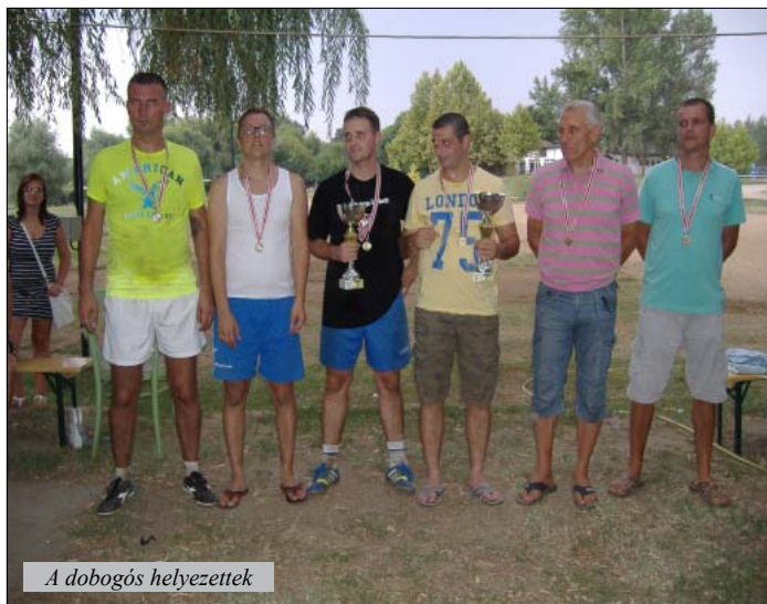
A dobogós helyezettek