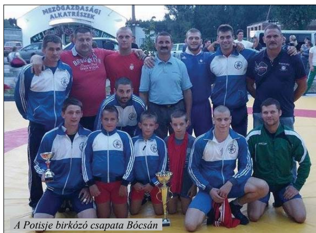
A Potisje birkózó csapata Bócsán