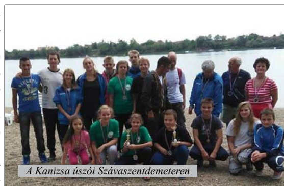
A Kanizsa úszói Szávaszentdemeteren