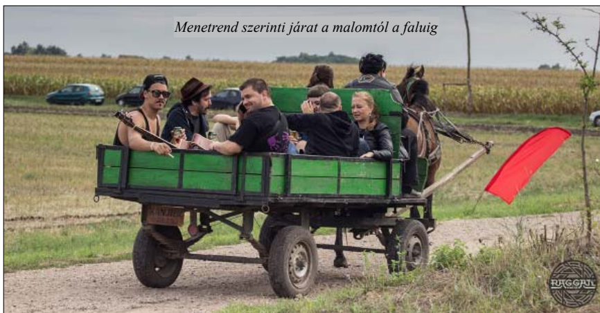
Menetrend szerinti járat a malomtól a faluig

teseket vártak, akik némi közösség-építő gyakorlatként rendbe rakták a helyszínt, felállították a színpadokat, a sátrakat, feldíszítették a környezetet, egyszóval megteremtették azt az idillt, amelybe olyan jó volt be-