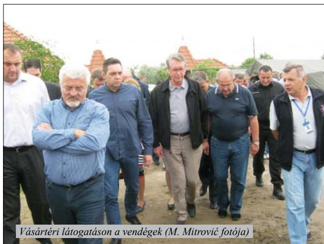
Vásártéri látogatáson a vendégek

– Szükség van a gyors és hatékony segítségnyújtásra. Nem tudjuk, hogy mit hoz a holnap. Annyi bizonyos, hogy jön az ősz, utána a tél. Együtt kell dolgoznunk, hogy megkönnyítsük ezeknek az embereknek a sorsát – hallottuk Csepurintól.