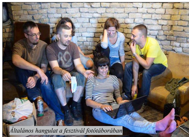
Általános hangulat a fesztivál fotótáborában

A pénteki napon sor került egy igazán színvonalas és szórakoztató slam poetry versenyre, akarom mondani az I. Regionális Slam Poetry Bajnokságra, amelyen vidék és város bájos és humoros ellentétei kerültek szembe egymással. Még aznap valamivel később bemutatkoztak a Press Szó fiatal újságírói, majd kezdetét vették a zenei programok, ahol az est fénypontjaként az Akkezzet Phi-ai nevű magyarországi rap formáció lépett fel. Vajdaságban itt először. Nekik is nagyon tetszett a fesztivál, s ők is a közönségnek, akik zuhogó esőben bulizták végig a koncertet.