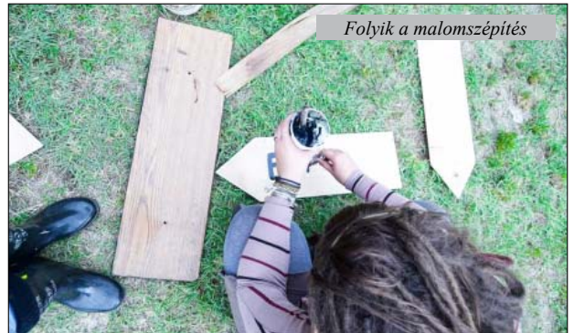
Folyik a malomszépítés

A fesztivál már augusztus 17-én kezdetét vette az úgynevezett Malomszépítő Táborral, ahová önkén-