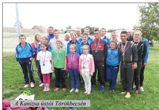
A Kanizsa úszói Törökbecsén