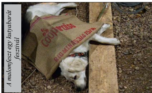
A malomfészt egy kutyabarát fesztivál