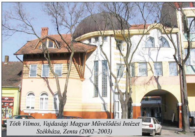
Tóth Vilmos, Vajdasági Magyar Művelődési Intézet Székháza, Zenta (2002–2003)

Nekünk pedig kiváló alkalom arra, hogy némi önvizsgálat során ismét, sokadszorra is megállapíthassuk: jó lenne, ha időnként érenyeinket, értékeinket saját magunk is fölismernénk, számon tartanánk. Mert – kétségkívül – nagyon jó érzés, ha némely dolgunk másoknak is tetszik. Rajtunk áll, hogy mi viszont tudjuk-e becsülni... -y