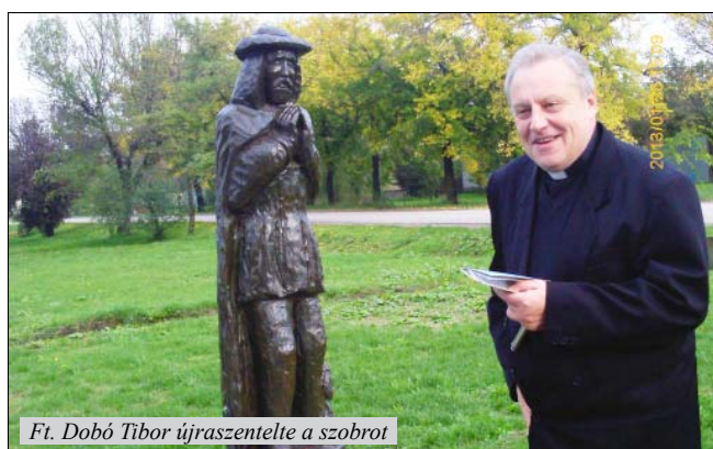
Ft. Dobó Tibor újraszentelte a szobrot