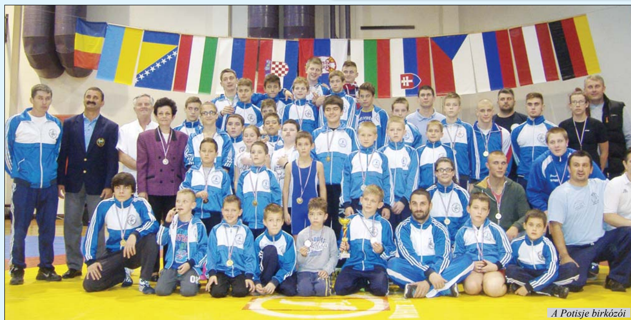
A Potisje birkózói