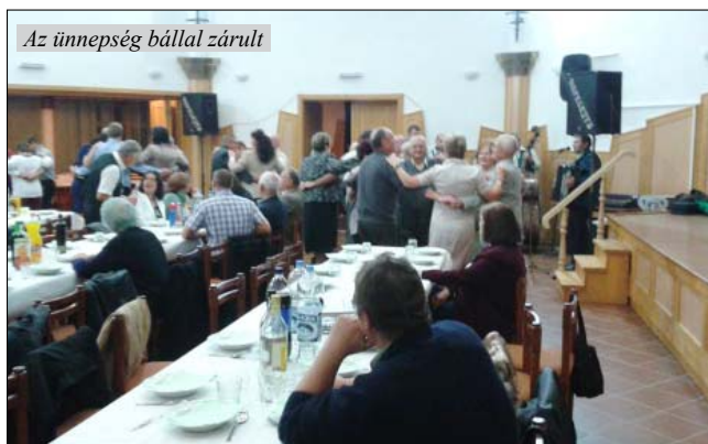
Az ünnepség bállal zárult