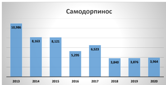
Кретање појединих уступњених прихода и трансфера у периоду 2013-2020 (јан-јун)