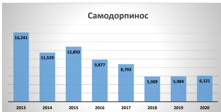
Кретање појединих уступњених прихода и трансфера у периоду 2013-2020 (јан-септ)